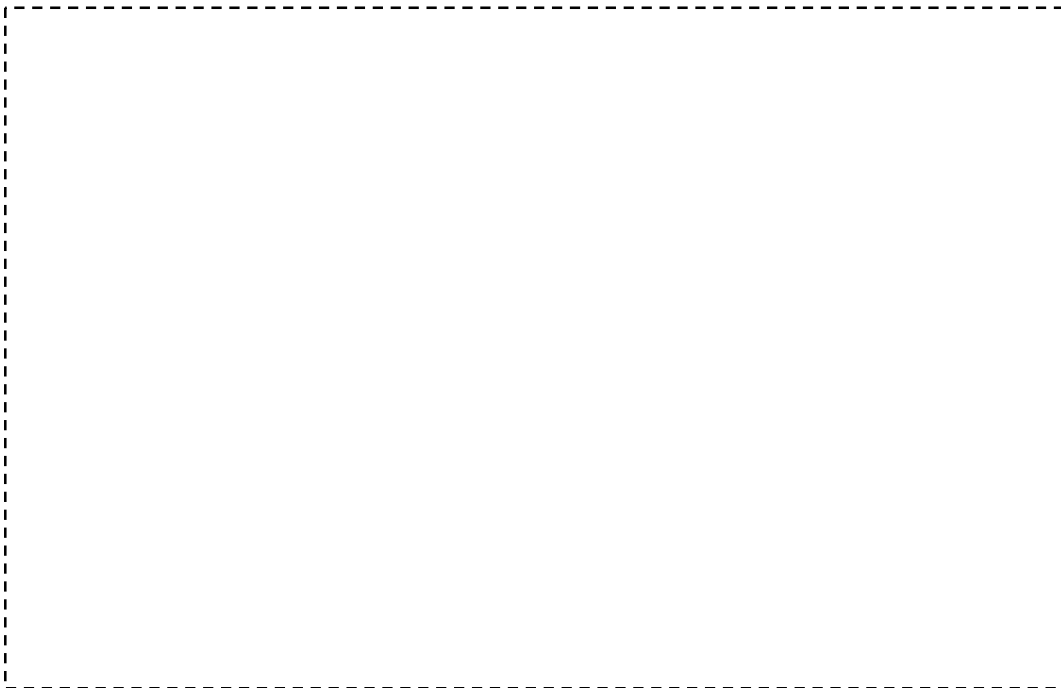
รูปที่ 2 สภาพภายในบ้านผู้สมัคร